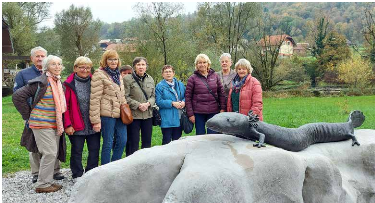
Prostovoljci naše župnijske Karitas na izletu v Belo krajino 17. oktobra letos