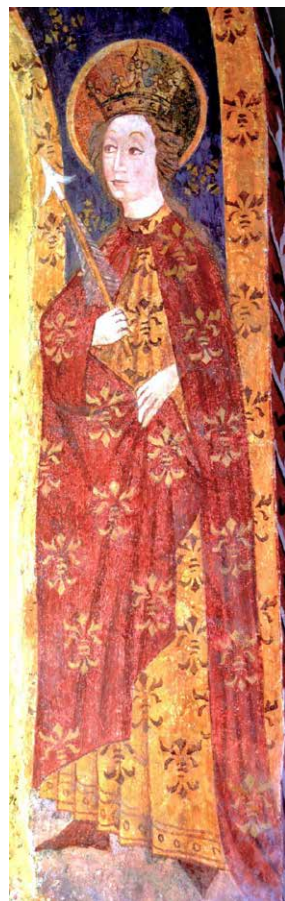
Sv. Uršula v podružnični cerkvi sv. Jakoba v Naklem pri Črnomlju