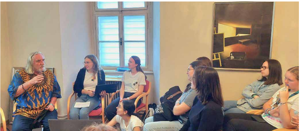
Tone Kerin med delavnico na Stični mladih 2024

Podoba sv. Terezije Deteta Jezusa v župnijski cerkvi sv. Martina na Bledu (njeno kapelo je leta 1940 poslikal Slavko Pengov)